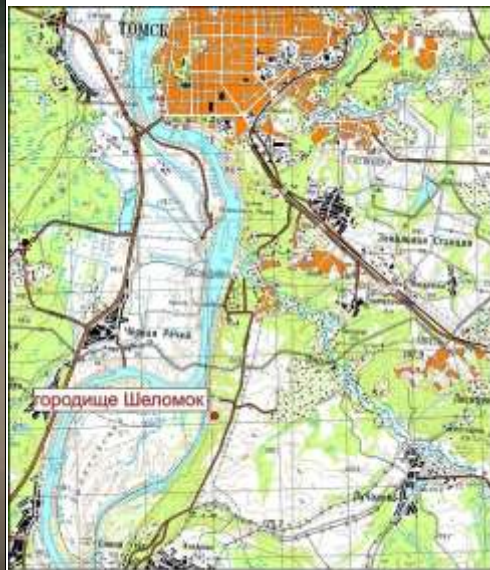
Рис. 1. Местонахождение городища Шеломок

Городище находится на Суровской протоке, пр. берег Томи