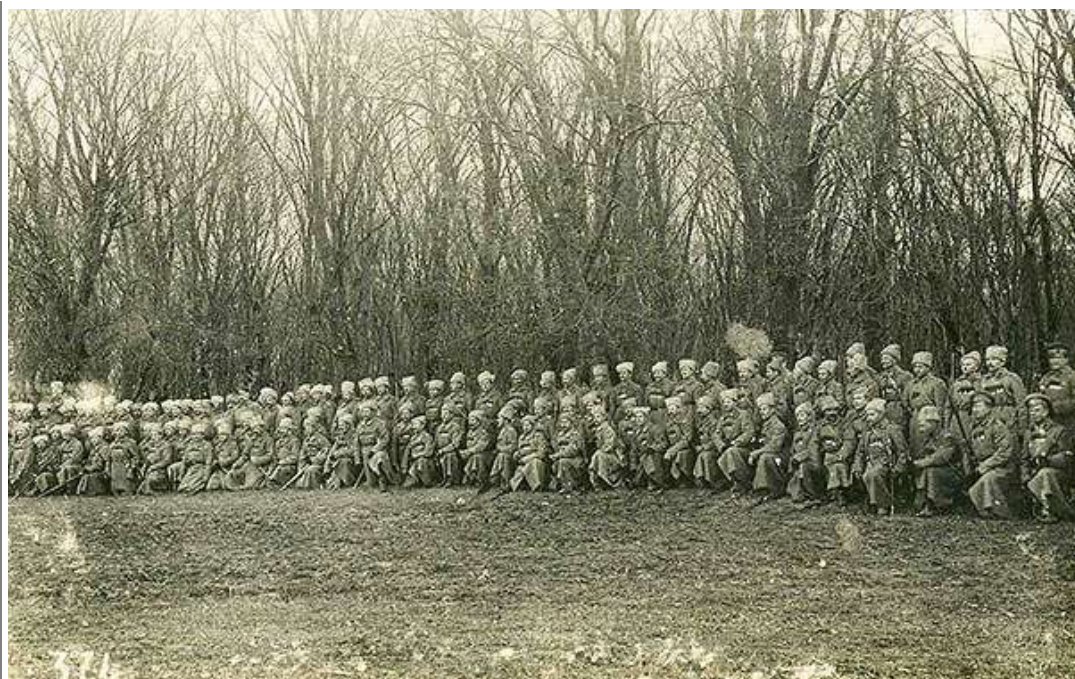
Георгиевские кавалеры 39-го пехотного полка. 1916 г.