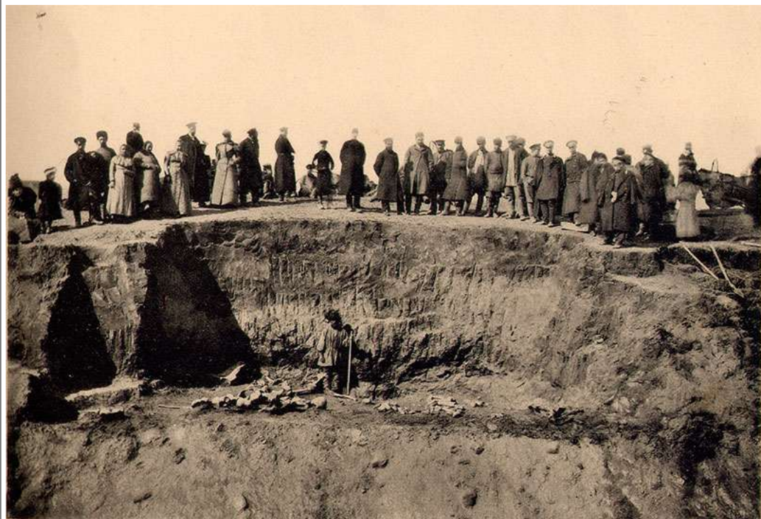
Раскопки в Лагерном саду. 17 апреля 1896 года.