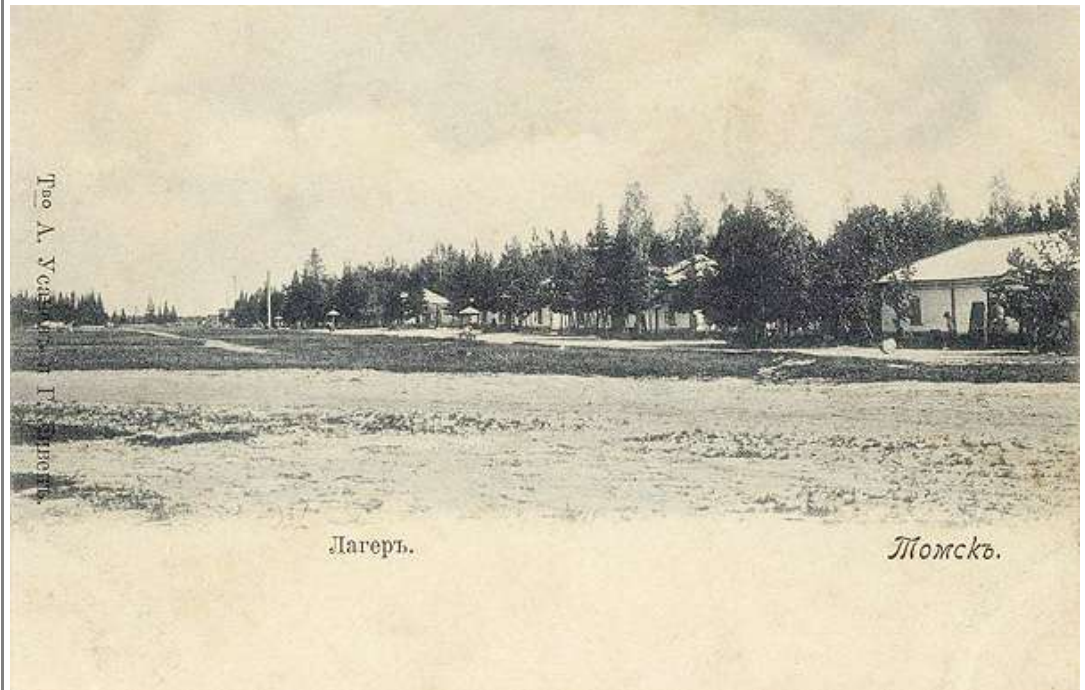
Лагерный сад на карте Томска 1898 года.