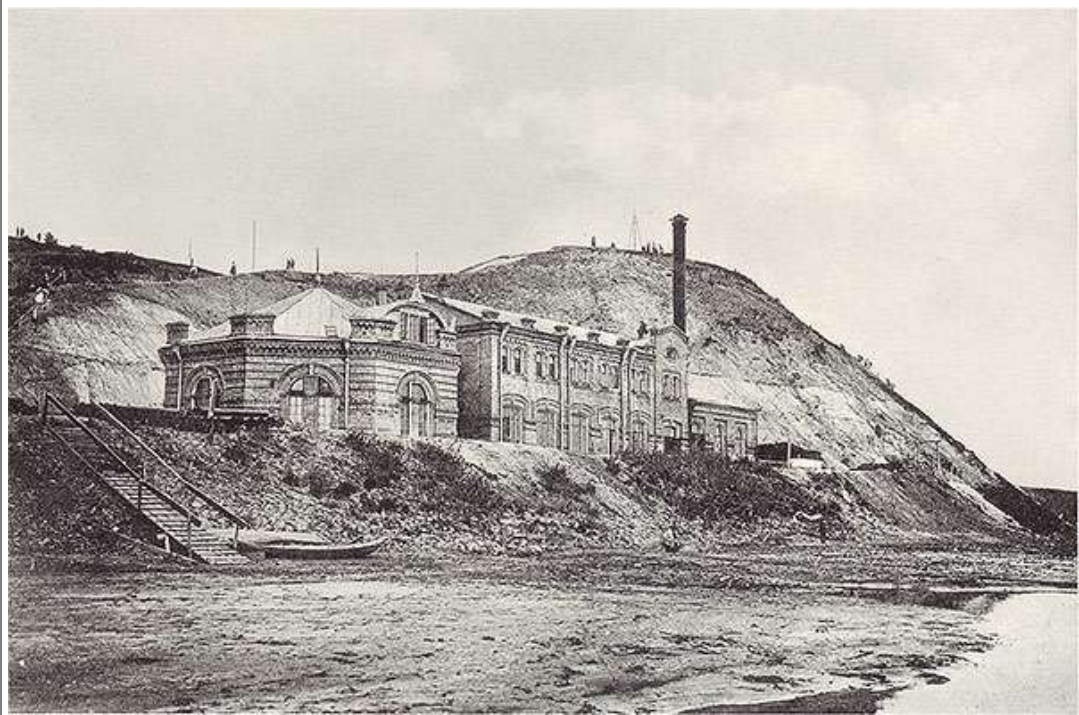
Городской водопровод (Водозабор на Томи у подножия Лагерного сада)