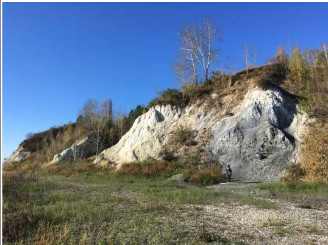
Классические геологические обнажения на правом берегу р. Томь