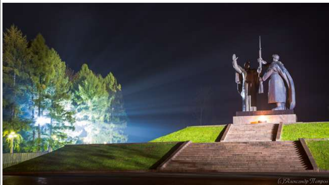
Монумент «Родина-мать вручает оружие сыну»

1. Место встречи (остановка «Лагерный сад» на ул. Нахимова в сторону города)