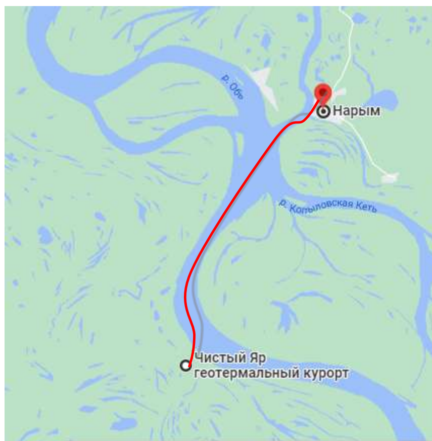
Чистый Яр- Нарым, Нарым – Чистый Яр. Расстояние 25 километров на водном транспорте КС -213.