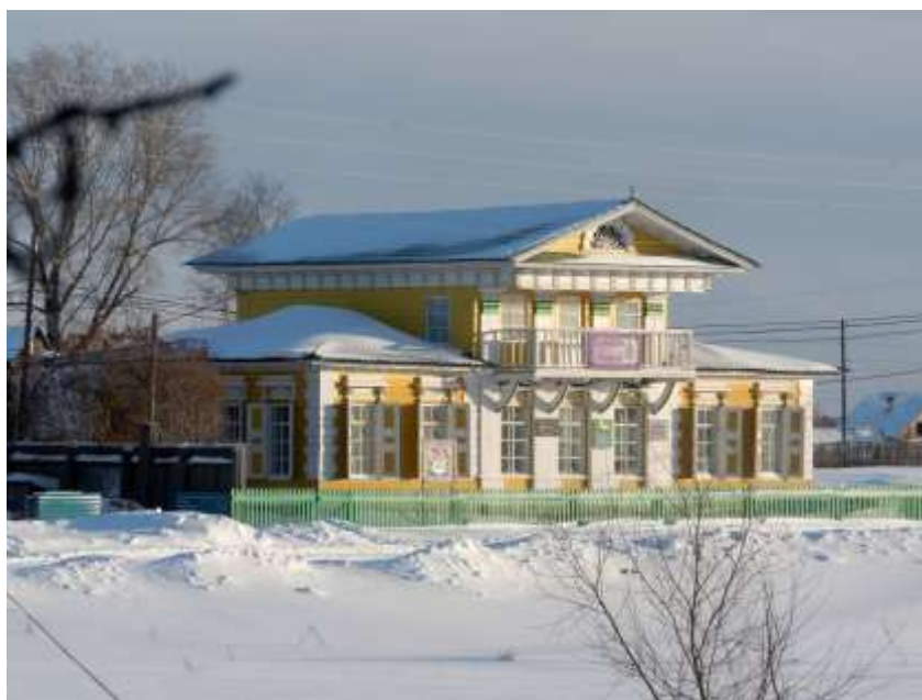
Дом купца Прянишникова в польском стиле.