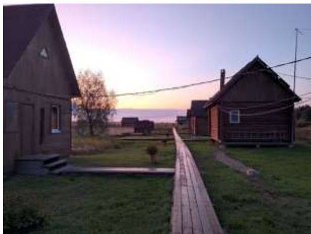
Домики для туристов «Чистый Яр»