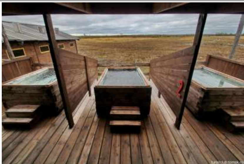
Термальные ванны «Чистый Яр»