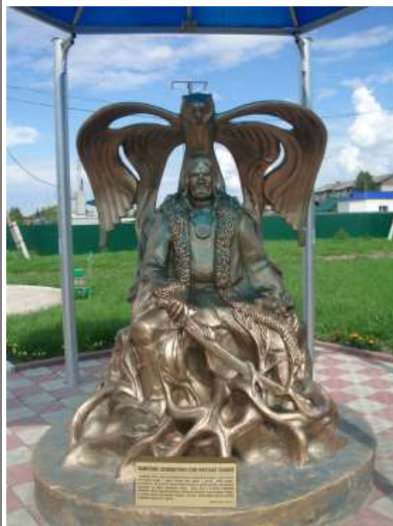
Памятник князю Пышке (с. Первомайское)