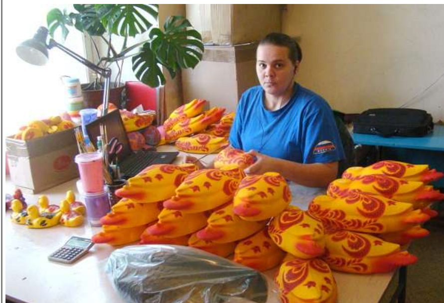
Туендатская сувенирная мастерская