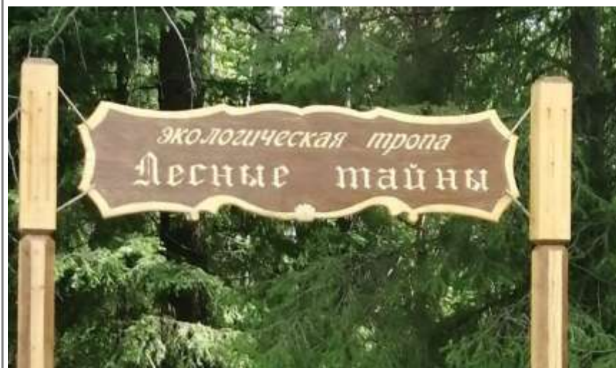
Экологическая тропа на «Яновом хуторе»