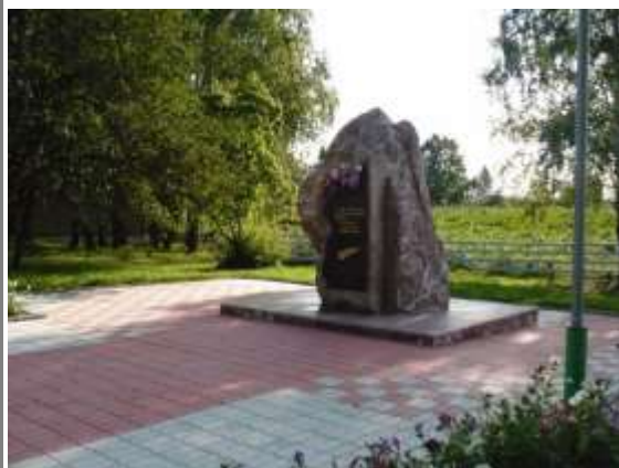
Камень скорби (с. Первомайское)