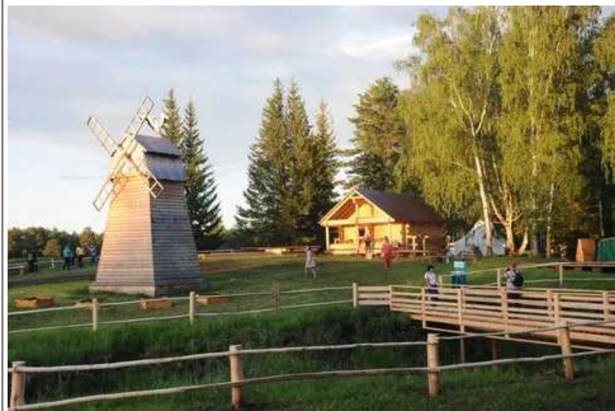
Этнокультурный комплекс «Янов хутор»