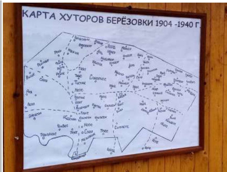
Карта хуторов Берёзовки 1904-1940 гг.