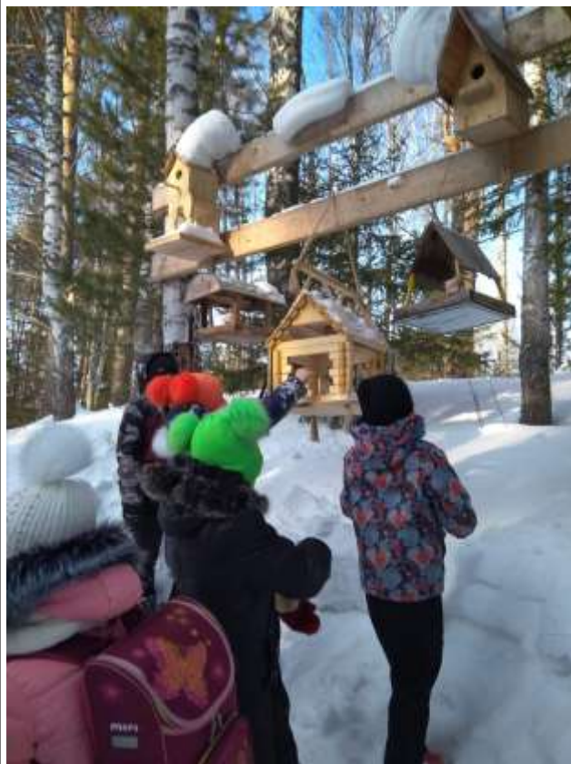
Прогулка по экологической тропе на «Яновом хуторе»